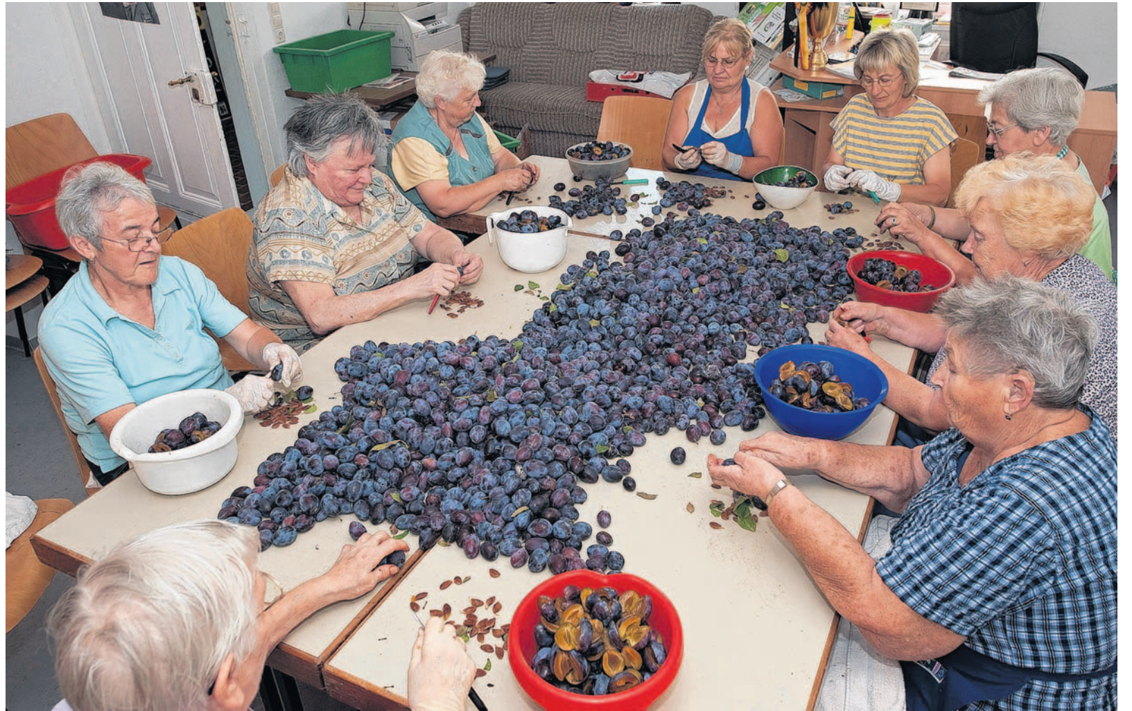
Die Rodauer Landfrauen entkernten von Montag bis Mittwoch im Alten Rathaus sechs Zentner Zwetschgen, um sie anschließend in einem Waschkessel zu leckerer Latwerge zu verarbeiten.

Nach dem ersten Durchgang vor zwei Wochen sind die Damen mit der jüngsten Ernte noch zufriedener. Die Pflaumen sind reif genug, um das volle Aroma zu liefern. Zunächst wird kollektiv entkernt, dass heißt, dass dem Obst per Hand die Kerne geklaut werden. Die landen im Bio-abfalleimer – anscheinend sind Zwetschgenkerne keine landwirtschaftlich oder sonstwie brauchba-